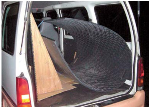
曲げて持ち運び簡単